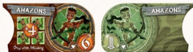
Amazonki - Aktywne i Wymierające